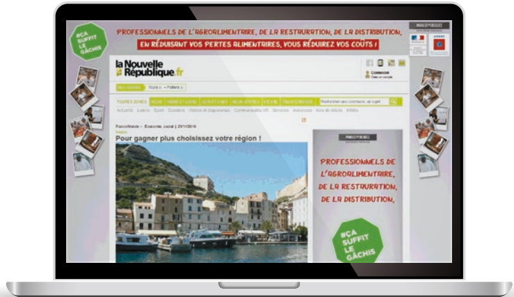
Habillage + Grand angle