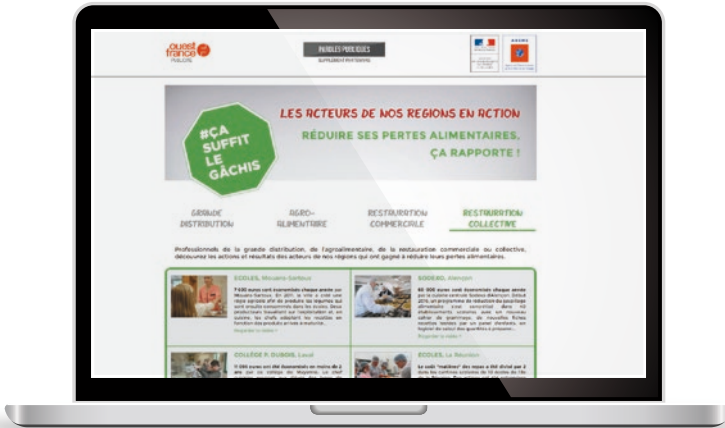
Espace dédié co-brandé